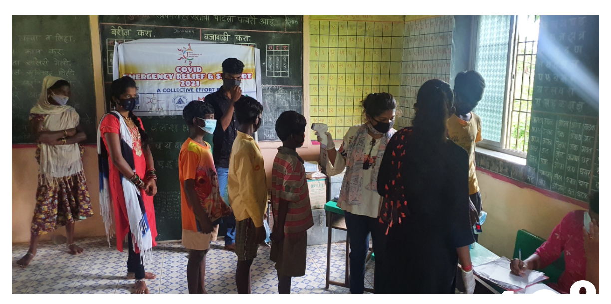
Distributing medicines to the tribals