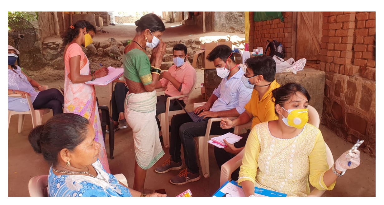
Volunteers distributing medicines to the tribals